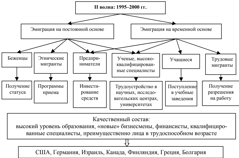
Рис. 2. Вторая волна эмиграции из современной России

ступенька для дальнейшей эмиграции и интеграции в новое принимающее сообщество. Брачная миграция, чаще женская, получает организованные формы и активно развивается. Сохраняется, хотя и в меньших масштабах, и формат получения статуса беженца.