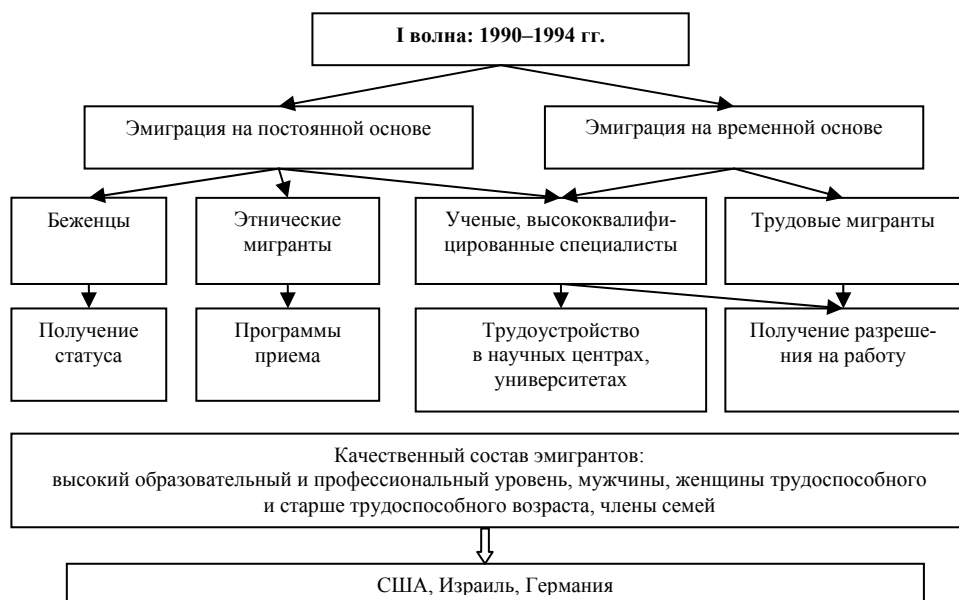
Рис. 1. Первая волна эмиграции из современной России

Основные страны приема эмигрантов из России – Германия, Израиль и США. Так, в 1993 г. на эти три страны пришлось 94,2 % от числа эмигрантов из России в страны дальнего зарубежья, в 1994 г. – 94,4 %.