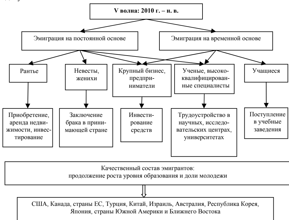
Рис. 5. Пятая волна эмиграции из современной России

V волна. Наконец, последний этап эмиграции приходится на период с 2010 г. по настоящее время. Развитие эмиграционных процессов в этот период принципиально не отличается от предыдущего (рис. 5). Количество выходцев из России в различных зарубежных странах достигло такого уровня, что самым популярным для въезда и натурализации становится канал воссоединения семей. Новые уезжающие члены семей вчерашних эмигрантов – это представители всех социальных групп и прослоек российского общества: бизнесмены, учащиеся, рантье, ученые, специалисты. Высокие показатели выезда из приграничных регионов в эти годы усиливаются.