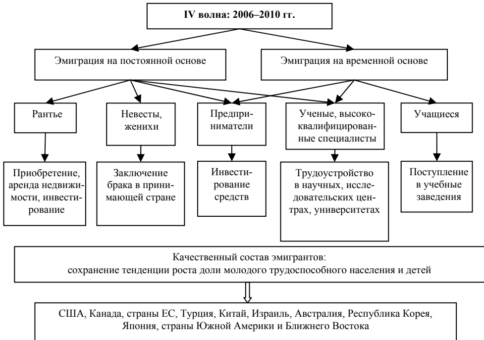
Рис. 4. Четвертая волна эмиграции из современной России

IV волна. На вторую половину 2000-х гг. (2006–2010 гг.) пришелся очередной экономический кризис. Всплеск безработицы и сокращение емкости внутреннего рынка товаров и услуг выталкивают российских предпринимателей за рубеж в поисках приложения своих капиталов и развития бизнеса. По мнению многих экспертов, в этот период они составили самую многочисленную группу эмигрантов. Остальные каналы отъезда и натурализации эмигрантов из России также продолжали активно работать, в том числе выезд на учебу, поиск рабочих мест для получивших образование (рис. 4).